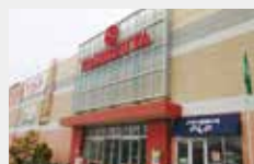
ヨンジヤ基目寺店